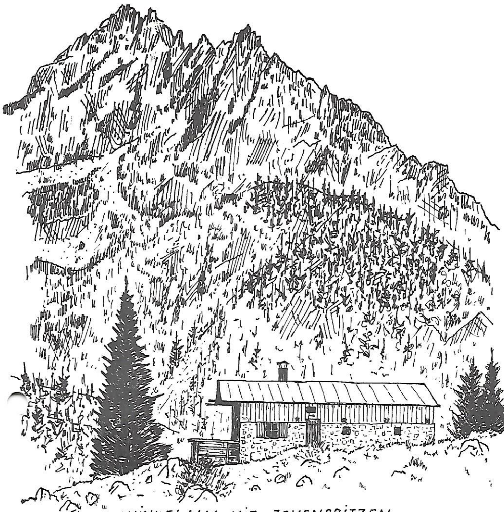
WINKELALM MIT JOVENSPITZEN

Zum Besitz der Sektion Oberland im Zahmen Kaiser gehört auch die Winkelalm. Sie liegt am Weg von Durchholzen zur Pyramidenspitze am Eingang zum Winkelkar. Vom Parkplatz südlich von Durchholzen ist sie in einer guten Stunde zu erreichen.